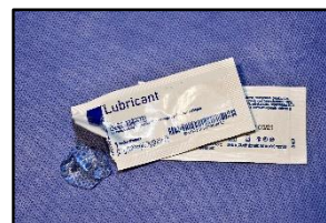
Lubricante soluble en agua